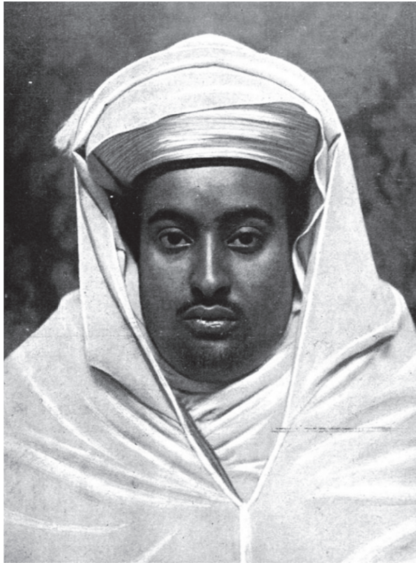
El Jalifa Muley el Mehdi ben Ismail ben Mohammed.