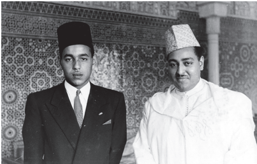
El Jalifa Muley el Hasan ben el Mehdi ben Ismail y el Príncipe Muley el Hasan, hijo del Sultán de Marruecos en 1949 (después Hassan II).